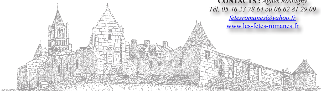
Abbaye de Sablonceaux telle qu'elle existait en 1794, d'après le dessin d'Ena Roberto

CONTACTS : Agnès Rostagny Tél. 05 46 23 78 64 ou 06 62 81 29 09 fetesromanes@yahoo.fr www.les-fetes-romanes.fr