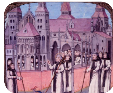
Abbaye de Citeaux

Prêt de costumes à Cozes, collège des Vieilles Vignes, aux écoles de Saint Georges de Didonne pour classe-découverte en Dordogne, à la section BTS Tourisme du Lycée Cordouan pour une opération de guidage dans les Abbayes de Chauvigny, Saint Savin, Montmorillon.